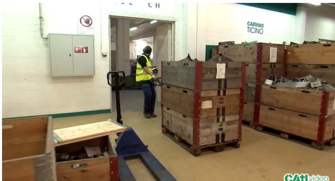
Logistica all'interno della sede di Rancate

A Rancate sono stati creati 15 posti di lavoro LADI e 5 LAS che a dipendenza degli sviluppi potranno essere incrementati.