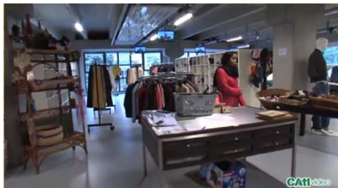
Commessa-venditrice al CATISHOP.CH di Pregassona

Questa attività permette il recupero di una grande mole di merce che potrebbe finire normalmente nei rifiuti ingombranti ed aumentare così i costi alla collettività.