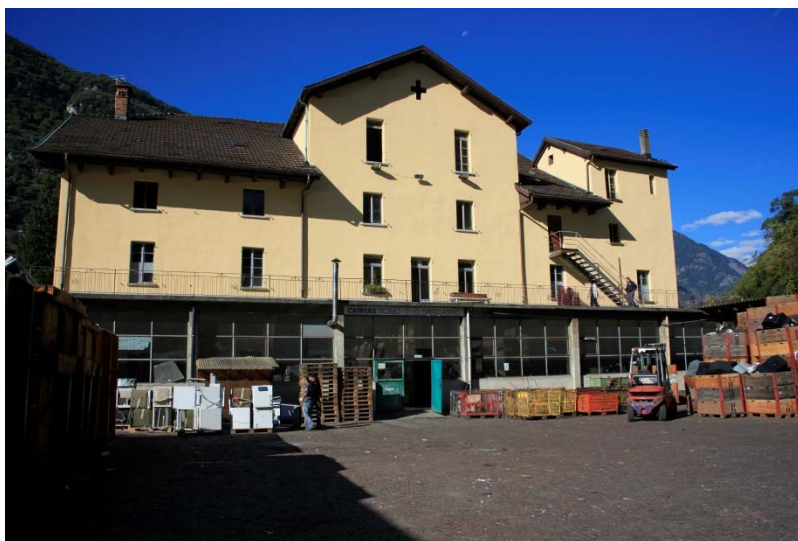
Il Centro Santa Maria a Polleggio

Sono previsti per il settore elettronica 30 posti: 21 LADI e 9 LAS.