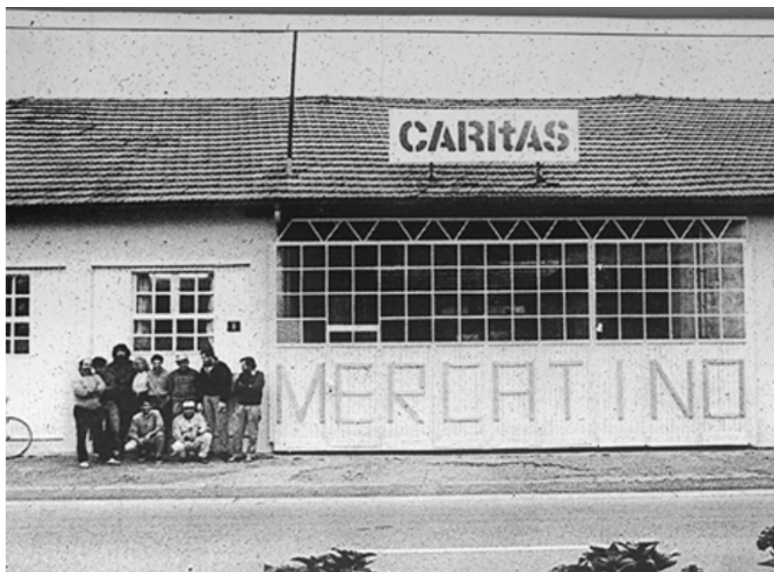
1988: operatori e operai all'entrata del primo PO in via Bagutti 6 a Lugano

Dopo una breve informazione su cosa è Caritas Ticino, il fascicolo presenta l'istoriato e le attività attuali con dati statistici globali che caratterizzano il funzionamento del Programma occupazionale di Caritas Ticino (PO-LADI) e (PO-LAS).