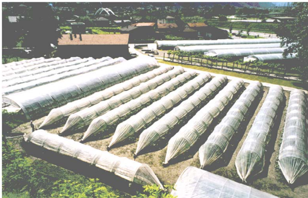
Produzione orticola presso il Centro Santa Maria di Pollegio

Nel settore sono occupate 27 persone: 11 LADI 16 LAS. L'azienda è pure riconosciuta come Azienda formatrice per apprendisti in orticoltura.