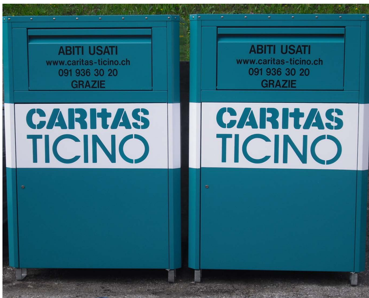
I nuovi cassonetti di abiti usati, prodotti in Ticino e collocati in diversi comuni del Cantone Clicca per vedere dove sono i cassonetti

Nella sede di Rancate sono stati creati 11 posti di lavoro (LADI) soprattutto per donne che si occupano della selezione degli indumenti usati provenienti dai nostri cassonetti per la vendita nei CATISHOP.CH, nei negozi dell'usato e a commercianti all'ingrosso in Svizzera e all'estero con una lunga collaborazione in particolare con la Caritas Georgia Tbilisi. In questo settore, con 2 utenti, troviamo lo svuoto dei cassonetti abiti (al momento un 125). Si tratta di svuotare i cassonetti presenti in tutto il Cantone, ove la gente deposita i sacchi con indumenti usati. Questi, caricati su furgoncini, sono trasportati a Rancate.