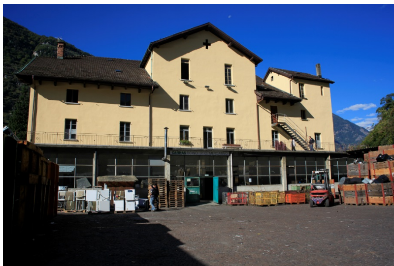
Il Centro Santa Maria a Pollegio

Sono previsti per il settore elettronica 20 posti: 13 LADI e 7 LAS.