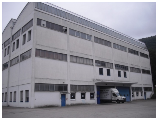
Al pian terreno di questo stabile nella zona industriale di Rancate, trova sede il PO

Dal 2015 in collaborazione con l'Ufficio delle Misure Attive e la Elinor SA, il Programma Occupazionale di Caritas Ticino è stato certificato con il Sistema di Gestione Qualità ISO 9001.