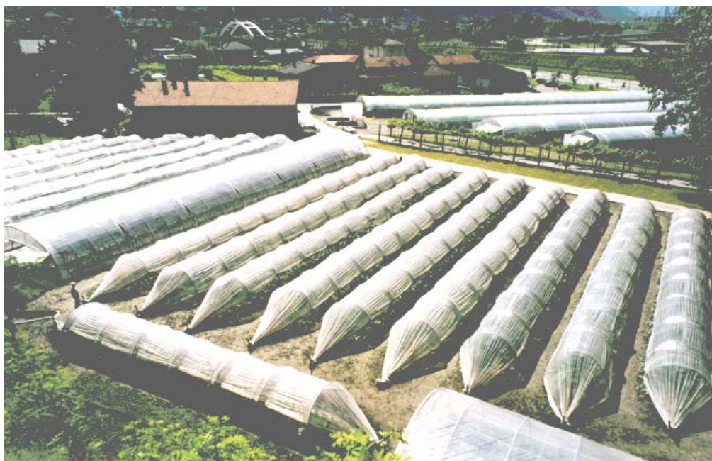
Produzione orticola presso il Centro Santa Maria di Pollegio

Nel settore sono occupate 18 persone: 6 LADI 12 LAS. L'azienda è pure riconosciuta come Azienda formatrice per apprendisti in orticoltura.